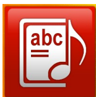
<ikona inne usługi>