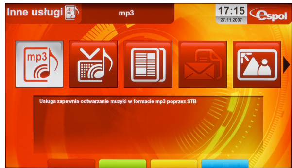
<ekran inne usługi>